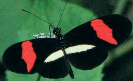
Callicore drugiū hemolimfa nuodinga