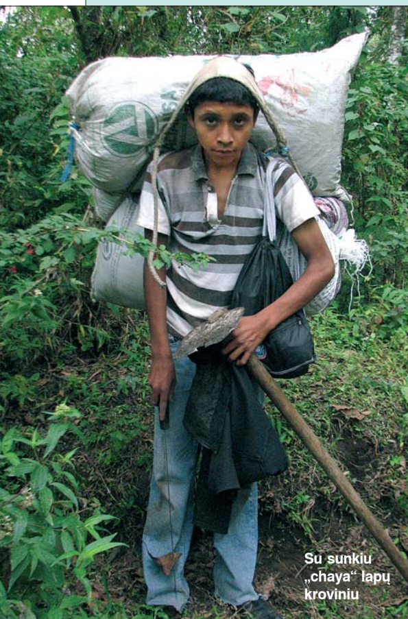
Su sunkiu „chaya“ lapų krovinium