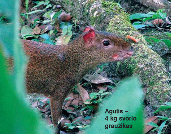
Agutis – 4 kg svorio graužikas