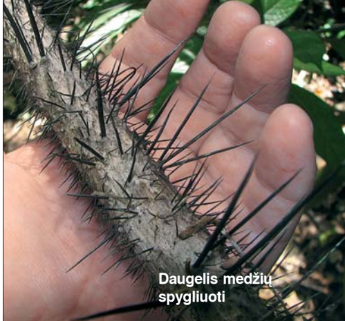
Daugelis medžių spygliuoti